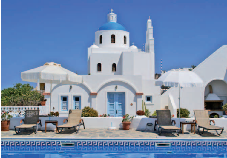
Hôtel Aethrio - Santorin