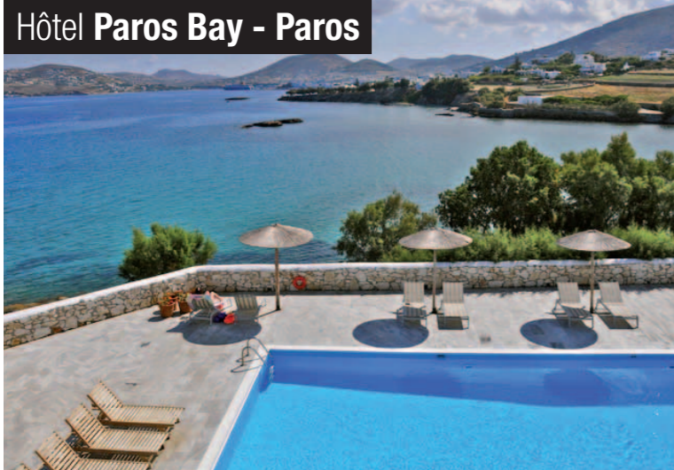
Hôtel Paros Bay - Paros