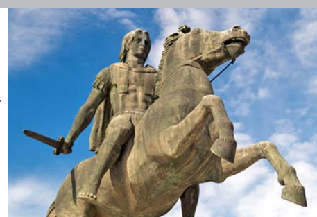
Grèce - Thessalonique - Statue d'Alexandre le Grand

Thessalonique / Pella / Naoussa / Vergina / Dion / Litochoro Palaios Panteleimonas / Chalcidique